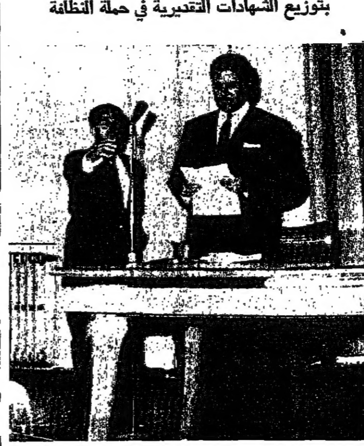
الامين احمد فوزي امين العاصمة يلقى كلمته في حفل توزيع الشهادات التقديرية على الفاترين في حملة اسبوع النظافة